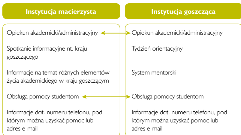
Schemat 7.3 Usługi świadczone przez instytucje macierzyste i przyjmujące dla studentów uczestniczących w mobilności

otrzymywać wsparcia przy załatwianiu spraw praktycznych. W każdym przypadku powinno się ich zachęcać do utrzymywania kontaktu z opiekunami w ich macierzystych uczelniach. Zadaniem tych opiekunów powinno być udzielanie wsparcia moralnego przebywającym za granicą studentom oraz, w razie potrzeby, interweniowanie w ich imieniu w instytucji goszczącej. Studentów powinno się również zachęcać do pozyskania wszelkich informacji na temat instytucji partnerskiej i skorzystania z systemu mentorskiego, jeżeli jest on dostępny. Jeżeli partner jest nowy i niezbyt dobrze znany, opiekun powinien nawiązać kontakt z instytucją przyjmującą.