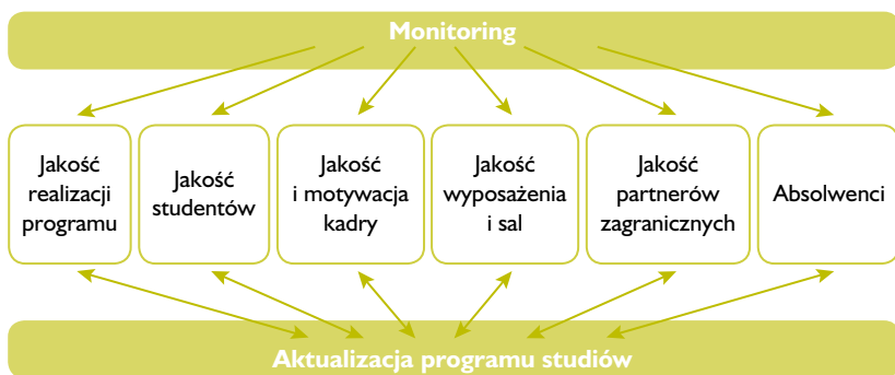
Schemat 7.1 Złożoność monitorowania

Należy również starannie monitorować szanse na zatrudnienie absolwentów. Prowadzenie bazy danych absolwentów umożliwiającą utrzymywanie z nimi kontaktu oraz monitorowanie poziomu ich zadowolenia wraz z upływem czasu pozwala na wykorzystanie tych informacji do celów marketingowych oraz daje cenne wskazówki dotyczące aktualizacji i wprowadzania zmian do programów studiów. Pozwala to na uzyskanie perspektywy czasowej i swoistego „współczynnika dojrzałości” w mierzeniu, ocenianiu i korygowaniu efektów kształcenia programu zintegrowanego z mobilnością, a także uwzględniania, w trakcie aktualizacji treści bądź nawet struktury programu, zmian zachodzących w społeczeństwie i na rynku pracy.